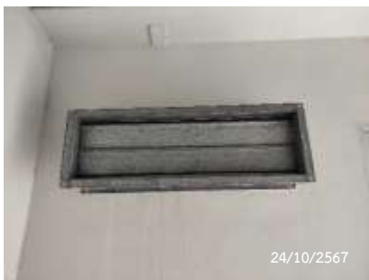
พัดลมระบายอากาศบันไดหนีไฟ