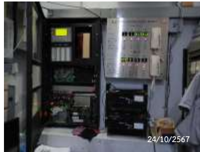
Fire Alarm Control Panel