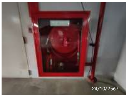
Fireman Hose Cabinet