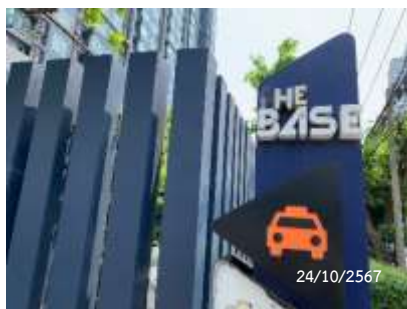
ป้ายเรียกรถสาธารณะ