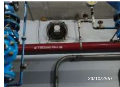
พัดลมระบายอากาศ