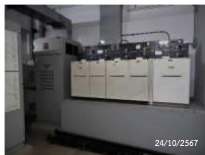
Ring Main Unit (RMU)