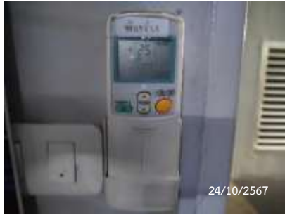
การตั้งอุณหภูมิเครื่องปรับอากาศ