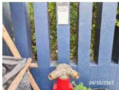
หัวรับน้ำดับเพลิง