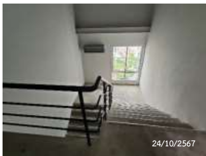
หน้าต่างระบายอากาศบันไดหนีไฟ