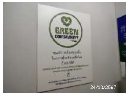
ป้ายรณรงค์การคัดแยกมูลฝอย