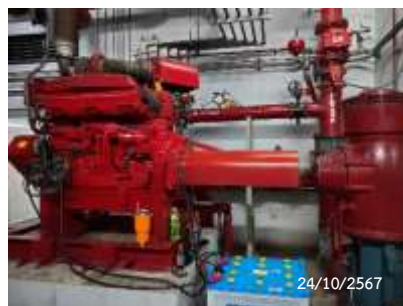
Fire pump system