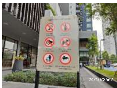
ภาพที่ 2.2-11 การประชาสัมพันธ์ในพื้นที่โครงการ