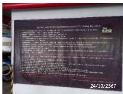
ระเบียบการจอดรถ