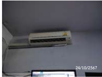
เครื่องปรับอากาศ