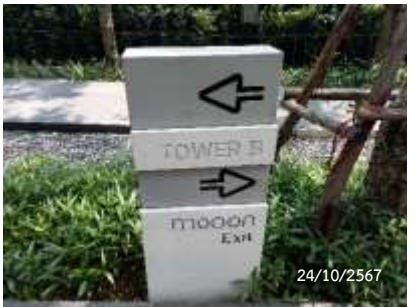
ภาพที่ 2.2-3 ระบบจราจรในโครงการ