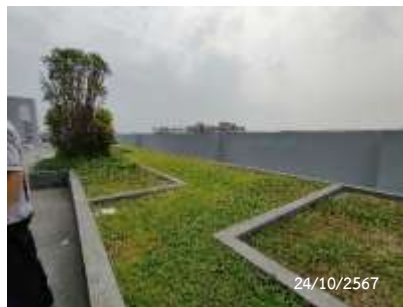
พื้นที่สีเขียวชั้นดาดฟ้า อาคาร A