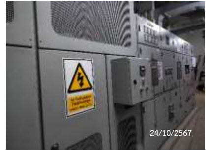
ป้ายเตือนอันตรายไฟฟ้าแรงสูง