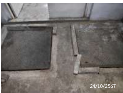
ถังเก็บน้ำชั้นใต้ดิน