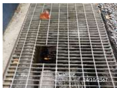
บ่อพักน้ำสุดท้ายพร้อมตะแกรงดักขยะ