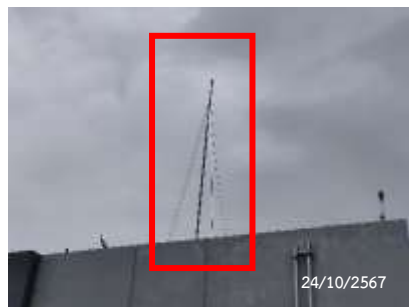
สายล่อฟ้า