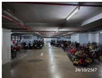
พื้นที่จอดรถจักรยานยนต์