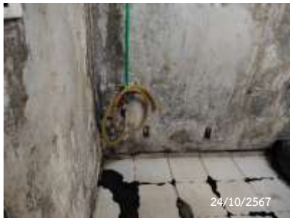
ก๊อกน้ำและท่อระบายน้ำ