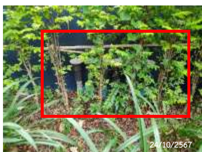
ท่อเติมอากาศระบบบำบัดน้ำเสีย