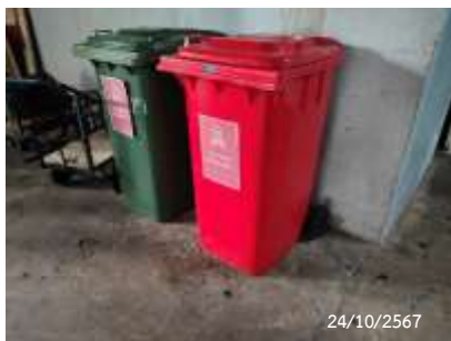
ถังขยะอันตราย