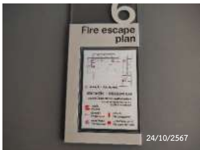
ผังแสดงเส้นทางหนีไฟ