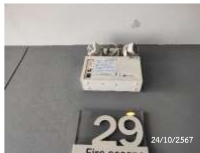
ป้ายบอกเลขชั้น