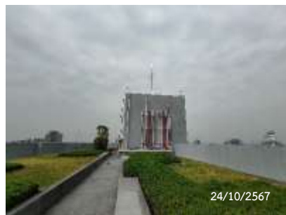
ถังเก็บน้ำชั้นดาดฟ้า