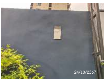
จุดรวมพล