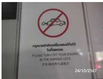
ป้ายห้ามติดเครื่องยนต์ทิ้งไว้