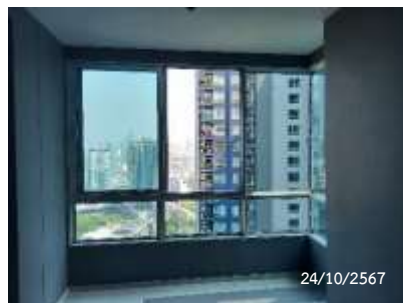
หน้าต่างระบายอากาศ