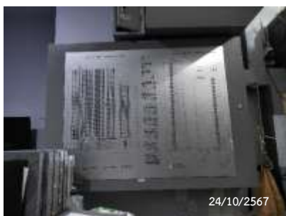
Graphic Annunciator Fire Alarm System