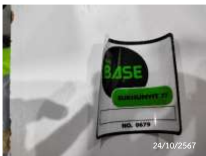
สติ๊กเกอร์ติดรถยนต์