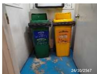
ห้องพักมูลฝอยประจำชั้น