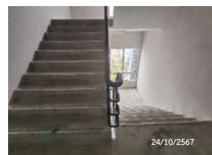
บันไดหนีไฟ