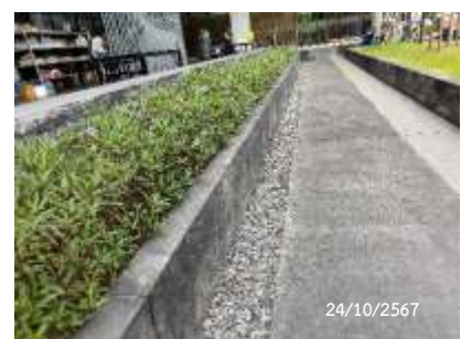
รางระบายน้ำรองโครงการ