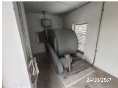
เครื่องอัดอากาศ