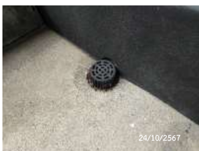
ท่อระบายน้ำชั้นดาดฟ้า