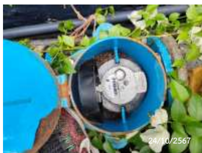
มิเตอร์น้ำ