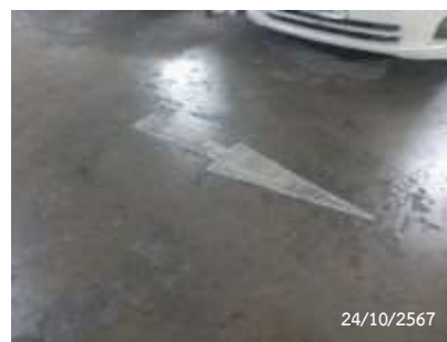
สัญลักษณ์จราจรบนพื้นทาง