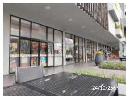
ภาพที่ 2.2-1 สภาพโดยรวมโครงการ