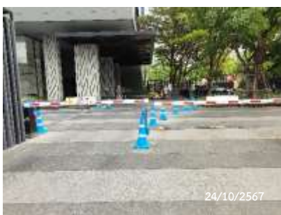
ไม้กั้นจราจร