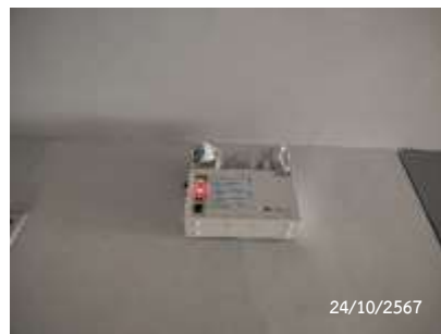
ไฟสำรองฉุกเฉิน