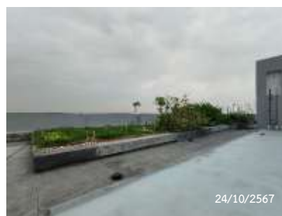
พื้นที่สีเขียวชั้นดาดฟ้า อาคาร B