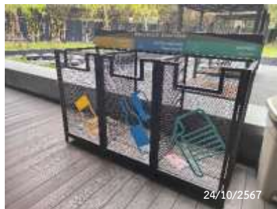
ถังขยะบริเวณพื้นที่ส่วนกลาง