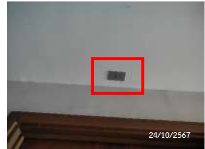
Fire Alarm Indicator Lamp