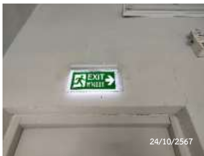
ป้ายบอกทางหนีไฟ