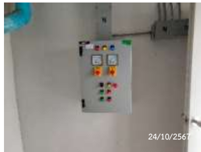
ตู้ควบคุมเครื่องอัดอากาศ