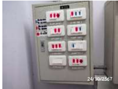
สวิตช์ไฟแยกแต่ละส่วนพื้นที่ส่วนกลาง