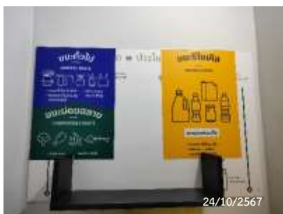
ป้ายรณรงค์การคัดแยกมูลฝอย