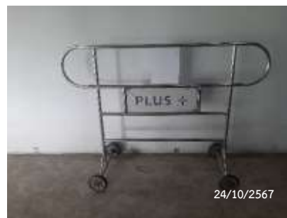
แผงกั้นจราจร