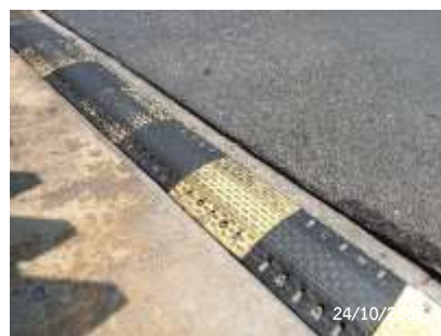
สัญญาณชะลอความเร็ว