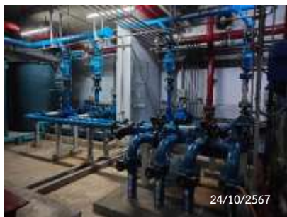
เครื่องสูบน้ำ