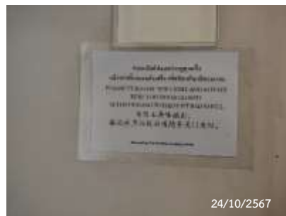
ป้ายเตือนหน้าห้องพักมูลฝอย