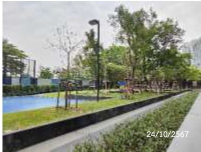
ไฟส่องสว่างรอบโครงการ