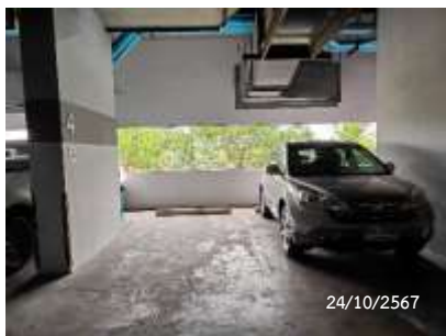
พัฒนาบรรยากาศชั้นจอดรถ